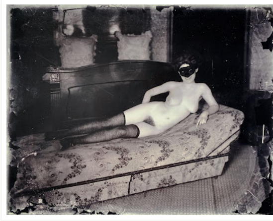
E. J. Bellocq, From "Storyville" series, 1912 c.