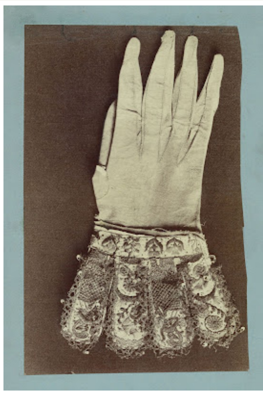
Anonymous, Glove, Paris, 1880 c.