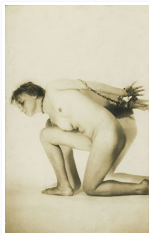
Anonymous, Untitled, 1920 c.