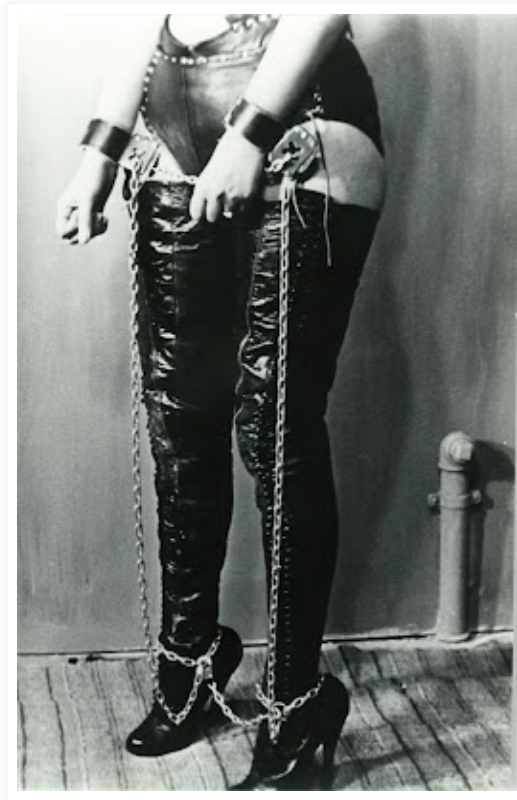
Anonymous, Untitled, Germany 1960 c.