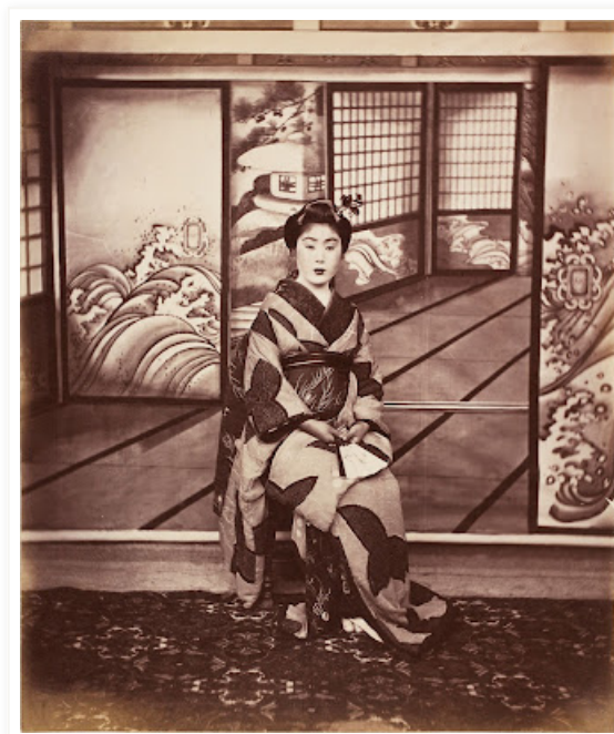
Anonymous, Geisha, 1870

"...Il collezionista come artista del montaggio fabbrica delle eterogeneità sulla base delle corrispondenze (per dirla con Baudelaire), delle affinità elettive (per dirla con Goethe e Benjamin), delle lacerazioni (per dirla con Bataille), o delle attrazioni (per dirla con Eisenstein), esponendo la verità, disorganizzando e non spiegando le cose..." [continua a leggere]