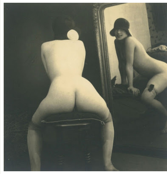
Anonymous, Untitled, 1920 c.