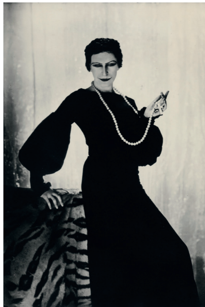
Foto © Cindy Sherman. © The Estate of George Hoyningen-Huene / Condé Nast. © Bettina Rheims.