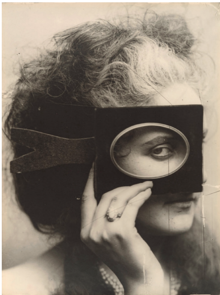
Pierre-Louis Pierson , Scherzo di follia ( La contessa di Castiglione ), Francia, circa 1863. Ingrandimento del 1930 circa, a cura di Braun & Cie.