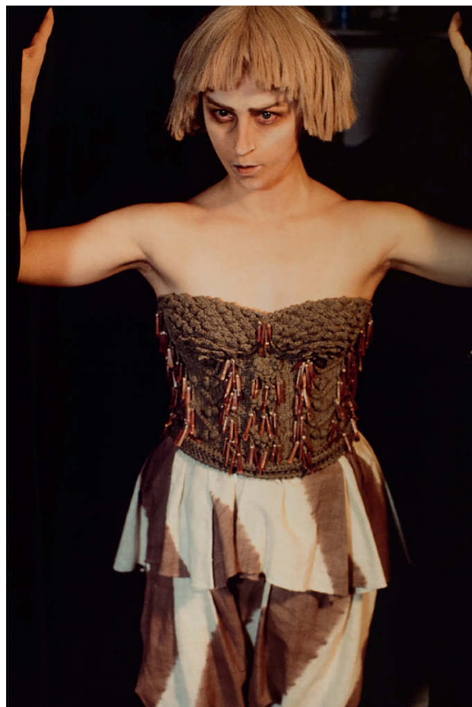
Da sinistra. Cindy Sherman , Untitled #127/A , Stati Uniti, 1985. George Hoyningen-Huene , Cecil Beaton as Elinor Glyn , Francia, 1930.